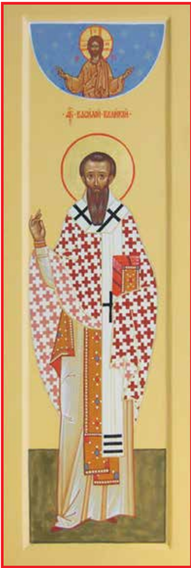
Святой Василий Великий, современная икона

В последний раз на государственном уровне встреча Новолетия как начала государственного (светского) и церковного Нового года в России состоялась 1 сентября 1699 года. В этом же году указами Петра Первого от 19 декабря 1699 года «О писании впредь января 1 числа 1700 года во всех бумагах лета от Рождества Христова, а не от сотворения мира» и от 20 декабря 1699 года «О праздновании Нового года» были изменены дата начала Нового года,