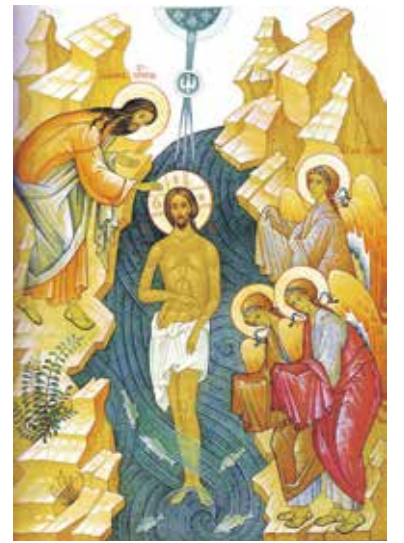
Крещение Господне, современная икона

Воду на Крещение освящали два раза. Накануне, в Крещенский сочельник — чином Великого освящения воды (Великой агиасмой), второй раз — в день Богоявления, на Литургии. В церкви воду освящали в купели, которая стояла в центре храма. На водоемах воду освящали, прорубая во льду иордан — прорубь в виде креста или круга.