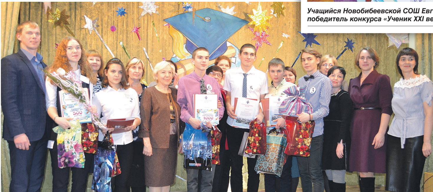
Лауреаты, организаторы и гости праздника

Конкурс проводят почти два десятка лет, а интерес к нему со стороны ребят только возрастает. Меняются времена, требования и правила. Неизменным остается желание заявить о себе, проверить свои лидерские качества, гибкость ума и эрудицию. С нее-то и начались испытания на отборочном этапе. Юноши и девушки отвечали на вопросы из четырех образовательных областей: естествознание, филология, математика и обществознание.