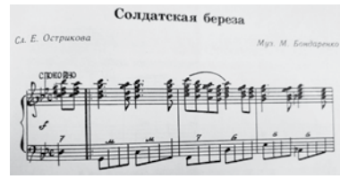
Партитура песни Острикова «Солдатская береза»

В 1991 году была выпущена последняя песня Острикова, записанная на грампластинке — «Женихи». Всего в течение его жизни на грампластинках страны было выпущено