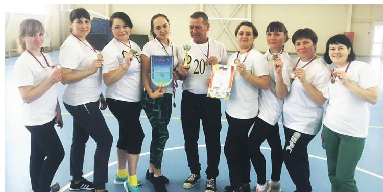
Коллектив СОШ № 21, занявший 3-е место