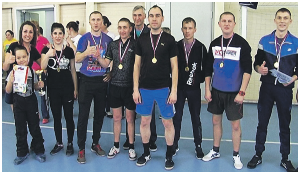
Команда отдела ОВД, победители соревнований среди предприятий и организаций

Среди малых предприятий лучшим с тал коллектив прокуратуры, вторые — районный суд, третьим стал коллектив МФЦ. Среди предприятий и организаций района I место заняла команда