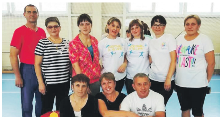
Коллектив Боровской СОШ, занявший 2-е место