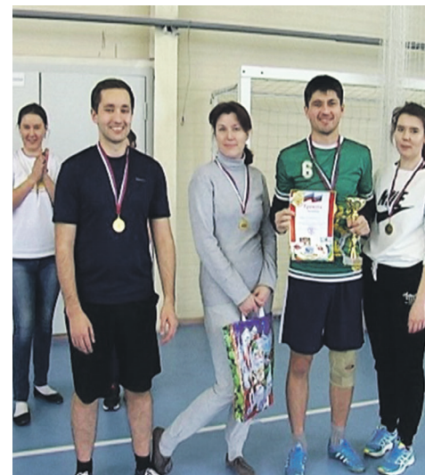
Команда прокуратуры, победители соревнований

школы и III — у команды школы № 21. 1 декабря состоится последний этап зачета в районную спартакиаду предприятий. А 8 декабря пройдет награж-