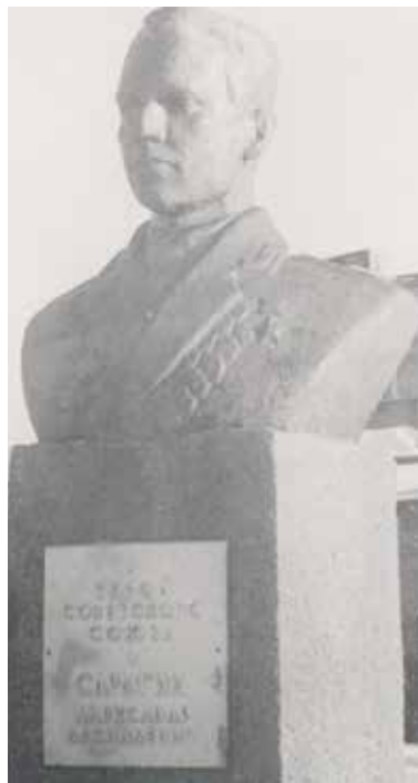
Бюст Сарыгина на Аллее Героев в Болотном, 1987 год