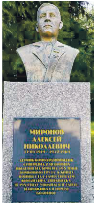
Бюст Миронова на Аллее Героев в Болотном, 2021 год

В 1942-1943 годах экипаж Миронова летал на бомбардировку аэродромов и станций в Витебске, Орше, Сеше, бывших в то время глубоким тылом противника. Бомбил Хельсинки, Будапешт и Берлин. Экипажем сброшено 395 тонн авиабомб, нанесены большие потери противнику. При налете на аэродром Витебска 4 октября 1942 года экипаж Миронова точным попаданием взорвал топлиохранилище и ангар, в котором находились 15 немецких самолетов. В одном из последующих налетов 28 октября