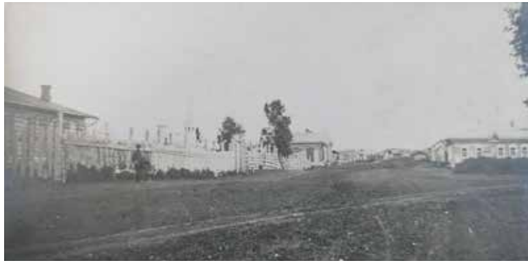
Фотография начала XX в. с изображением вероятных строений Болотнинской учебно-показательной кустарной тележной мастерской.

После Февральской революции 1917 г. учебно-показательные кустарные мастерские были подчинены кустарному отделу Томского губернского народного собрания. На губернском уровне