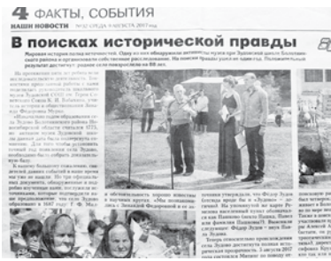
Фрагмент статьи Екатерины Горшковой «В поисках исторической правды», газета «Наши новости», номер от 9 августа 2017 года

Конечно, свидетелей давних событий уже не найти. Но три официальных документа, обнаруженные и подробно изученные нами, послужили источниками, которые подтвердили наше предположение, что село Зудово образовано в 1687 году: это книга Г.Ф.Миллера «Историко-географические описания Томского, Кузнецкого и других уездов Сибири, выполненные в 1734–1739 гг.», «Чертежная книга Сибири 1701 года», составленная в 1699–1701 годах С.У. Ремезовым и его сыновьями и работа В.И. Косовца «Заселение