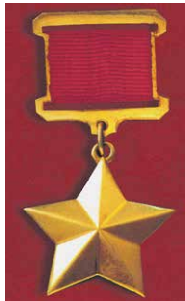
Медаль «Золотая Звезда» Героя Советского Союза

Указом Президиума Верховного Совета СССР от 24 марта 1945 года звание Героев Советского Союза было присвоено сразу трем нашим землякам: Калистрату Ивановичу Бабахину, Ивану Семеновичу