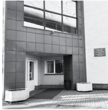
Государственный архив Томской области (ГАТО). Здесь Косовец познакомился с хранящимися в фондах ревизскими сказками, сделал с них копии, перевел и составил таблицы

В разнообразных научных краеведческих источниках Владимир