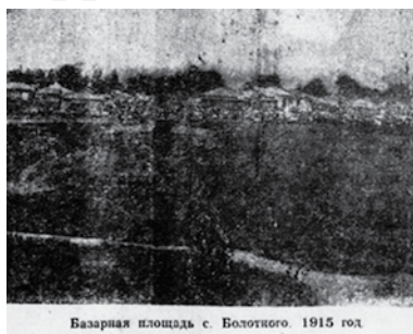
В номере газеты «Путь Ильича» от 25 марта 1967 года была впервые опубликована фотография Базарной площади села Болотного 1915 года

«...Свое название новый населенный пункт, очевидно, получил от речки Болотной, на берегах которой было основано село. Дальнейшему росту Болотного способствовало