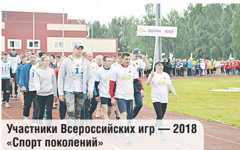
Участники Всероссийских игр — 2018 «Спорт поколений»

В это же время на стадионе спорткомплекса «Восток» город принимал участников этапа международных соревнований Всероссийских игр — 2018 «Спорт поколений». Эти соревнования в России проводятся десятки раз. И, конечно, почетно,