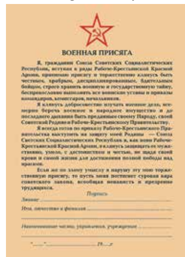
Бланк индивидуальной военной присяги, 1941 год

На каждого призывника оформлялась «Призывная карта». На ее обратной стороне предпоследний пункт содержал номер призывной команды и дату отправки команды. Призванный включался в «Именную список на команду №...», указывался условный или действительный номер части и ее адрес. Для определения действительного номера существовал особый справочник — «Справочник условных