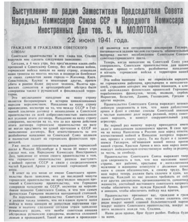
Текст выступления по радио 22 июня 1941 года В. М. Молотова о начале войны, опубликованный 23 июня 1941 года во всех печатных изданиях СССР

Мобилизации подлежали военнообязанные четырнадцати возрастов, родившиеся в 1905 — 1918 годах, то есть те, кому на тот момент было 23-36 лет. Все они относились к военнослужащим