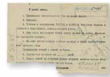
Оборотная сторона повестки с пояснениями, июнь 1941 года

В то же время в Болотнинский районный военкомат было подано множество заявлений от добровольцев разных возрастов, стремившихся попасть на войну. В первые дни войны считалось, что она продлится недолго, поэтому часть таких добровольцев искренне опасались, что они не успеют попасть