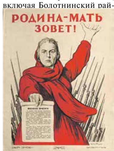
Знаменитый плакат Ираклия Тондзе, распространенный в первые же дни войны по всей стране

Первая волна мобилизации продолжалась семь суток. На территории современной Новосибирской области, включая Болотнинский рай-