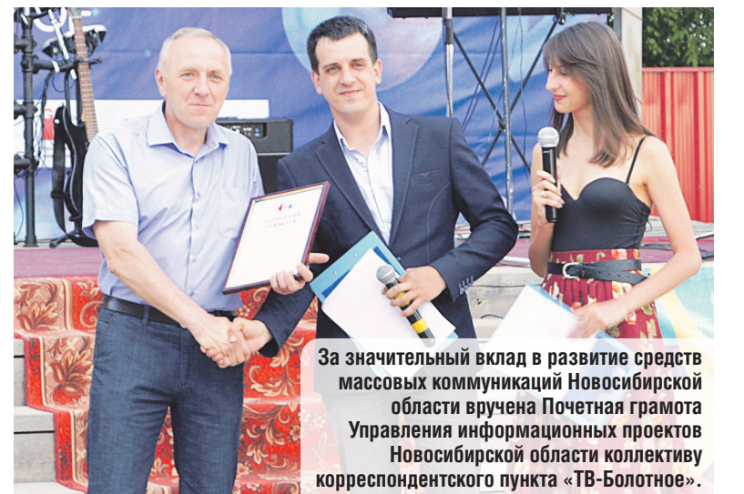
За значительный вклад в развитие средств массовых коммуникаций Новосибирской области вручена Почетная грамота Управления информационных проектов Новосибирской области коллективу корреспондентского пункта «ТВ-Болотное».

В течение всего вечера на сцене выступали местные самодеятельные и танцевальные коллективы: ансамбль русской песни «Сибирский сказ», вокальный ансамбль «Тоника», вокально-инструментальные группы «АрхИдея» и «Прецедент». Также показал свое мастерство танцевальный коллектив «Звездочки». Маленьким болотнинцам тоже не пришлось скучать, для них