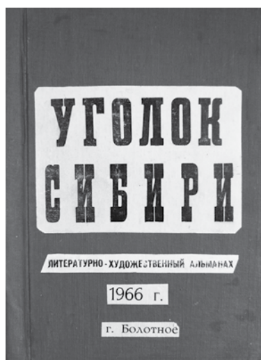
Обложка и одна из страниц литературно-художественного альманаха «Уголок Сибири», Болотное, 1966 год