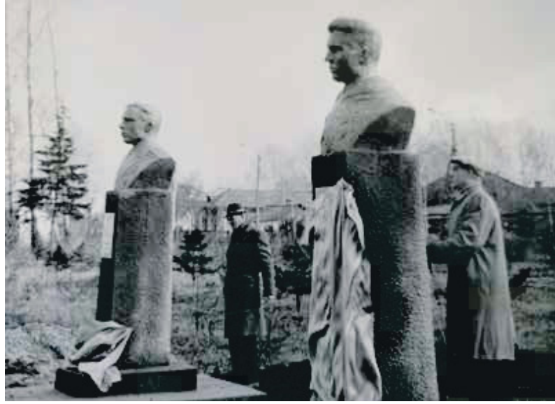
Открытие бюстов болотнинцев — Героев Советского Союза на Аллее Героев в Болотнинском городском парке 24 октября 1987 года

Из статьи «Аллея Героев» в номере от 31 октября 1987 года болотнинской районной газеты «Путь Ильича» нам известна причина переноса даты открытия Аллеи Героев в Болотном: «...24 октября ... состоялся митинг в программе международной Недели действий за разоружение, Всемирной антивоенной акции «Волна