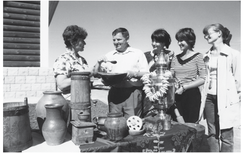
2002 г. Работа передвижной выставки в селе Турнаево

Наш музей — участник всех семи Культурных Олимпиад Новосибирской области. Трижды, в 2013 г. с золотой медалью, в 2014 г. с серебряной медалью и в 2017 г. с золотой медалью, становился победителем и призером Культурной Олимпиады в номинации «Лучший выставочный проект, посвященный памятным датам района, имеющим важное историческое, культурное значение для района». В 2022 году мы не дотянули до призового места, стали в своей подгруппе четвертыми, но все равно принесли в копилку своей команды несколько таких нужных для общей победы баллов. И только