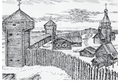
Предполагаемый вид Тобольского острога — будущего Тобольска, построенного в 1587 году недалеко от Искера. В 1590 году Тобольск стал центром Тобольского разряда, которому была подконтрольна территория Западной Сибири, вошедшая в состав Русского государства. Русские источники конца XVI начала XVII веков называли Тобольск первоначально, столичным городом Сибири

Кучума, 6 князей, 15 мурз и 300 воинов. В плен попали 5 младших сыновей хана, 8 жен из его гарема, 5 приближенных хана, 150 воинов. «...да сто, государь, потогло на Оби реке, как оне поплыли за Обь-реку, и твои... царевы...люди их побивали из пищалей и из луков; да пятьдесят...человек служилых взяли живых, и я...повелел их побить, а иных перевешать». Кучум с отрядом в 50 воинов успели вырваться и «поутекали с бою». 70 казаков атамана Третьяка Жареного с сыном боярским Глебовым настигли и уничтожили ханских воинов, однако, Кучума среди них не оказалось. Всего убитыми хан Кучум потерял более 350 человек. Из людей воеводы Воейкова было убито и ранено около 50 человек. Покончив с остатками разбежавшихся по окрестностям кучумовцев, 25 августа 1598 года Воейков со своим войском, пленными и добычей двинулся прежней дорогой назад в Тару. В 1599 году попавшая в плен семья Кучума была доставлена в Москву, где к тому времени успела обосноваться другая часть семьи хана, попавшая в плен ранее. Члены семьи Кучума, попавшие в Москву, были известны как царевичи и князья Сибирские, многие из них впоследствии отличились на воинской службе, со временем все они приняли православие и пополнили российское дворянство.