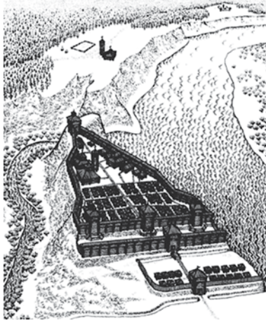
Предполагаемый вид города Искера — столицы Сибирского ханства при хане Кучуме