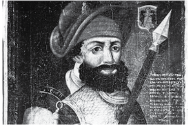
Одно из изображений Ермака XVII века. Известно, что не существует прижизненных портретов («парсунов») этого атамана; имеющиеся поздние изображения не передают настоящие черты лица Ермака, как выглядел он в реальности, мы не знаем

В 1574 году Иван Грозный даровал промышленникам братьям Якову и Григорию Строгановым, успешно отбившим атаки Маметкула на их пермские вотчины, право иметь собственное войско. В том же году Строгановы получили грамоту, которая позволяла им на реках Тахчее, Тоболе, Иртыше и Оби и иных реках в пределах Сибирской земли строить крепости, открывать там железные промыслы, заниматься рыбной ловлей и возделывать пашню. Строгановы стали набирать «охочих» людей в свое войско. Вскоре, согласно летописям, с Волги к ним прибыла казачья дружина