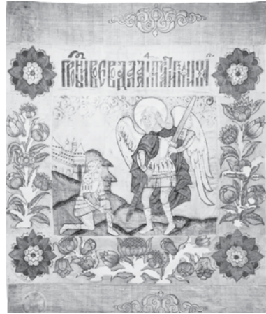
Одно из знамен войска Ермака. Оружейная палата Московского Кремля

В 1555 году (год спустя после того, как царь Иван Грозный в письме к английскому королю уже именовал себя «повелителем Сибири») в Москву прибыли послы от хана Сибирского ханства