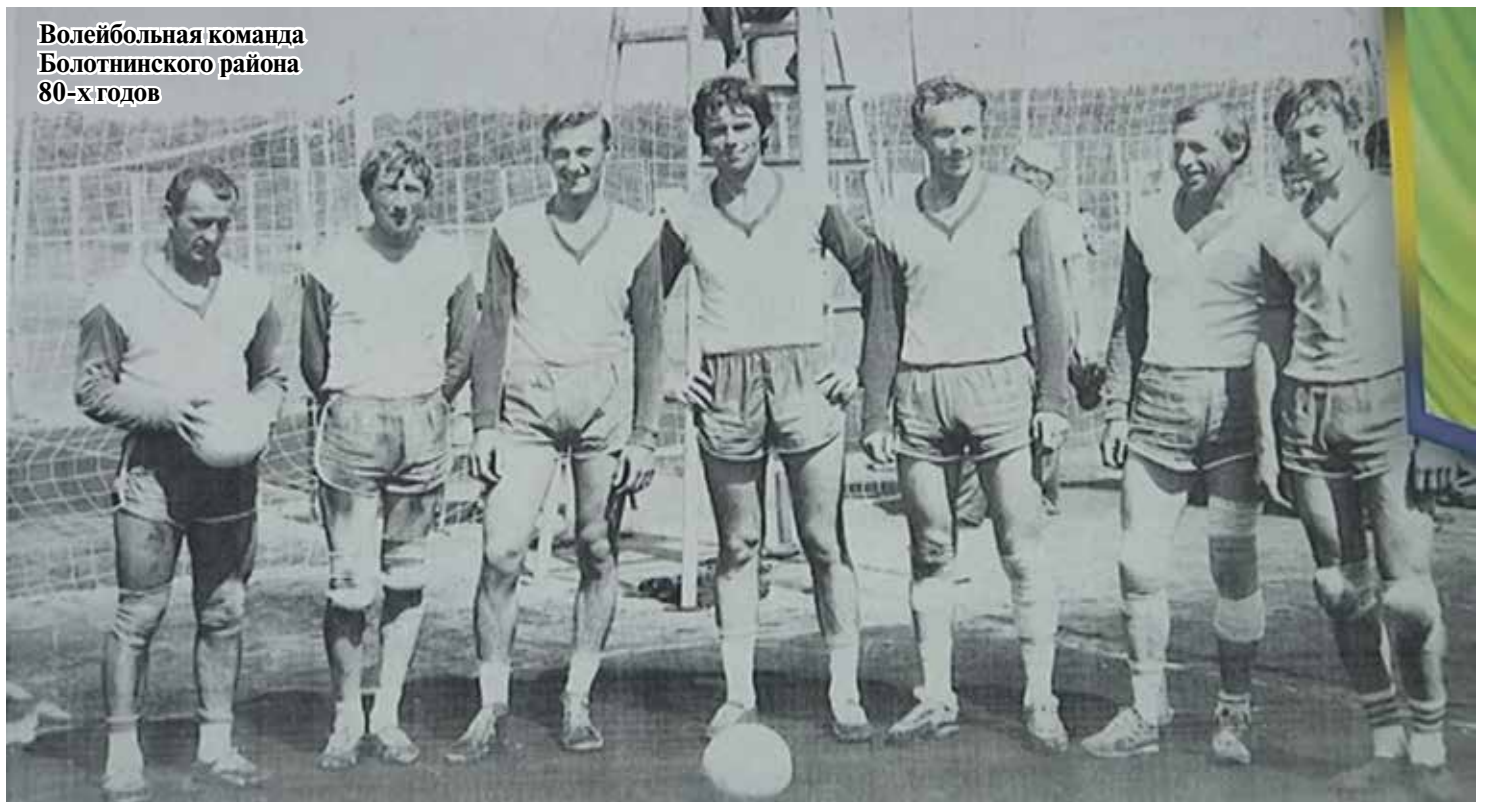
Волейбольная команда Болотнинского района 80-х годов