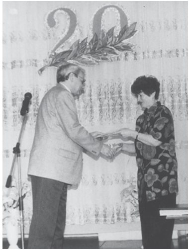
Фотография с юбилейного мероприятия Болотнинского районного историко-краеведческого музея, май 2001 года