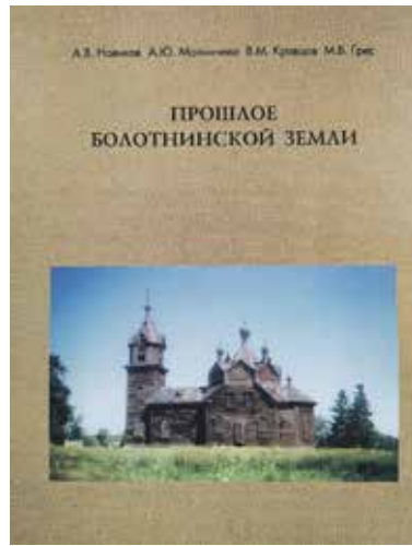
Книга «Прошлое Болотнинской земли», помощь в создании которой оказал коллектив Болотнинского районного историко-краеведческого музея, 2003 год