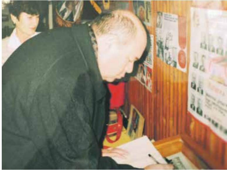
Министр культуры Российской Федерации М. Е. Швыдкой оставляет свою запись в музейной книге отзывов, январь 2001 года

Из Москвы была получена правительственная телеграмма с поздравлениями министра культуры Швыдкого: «...сердечно поздравляю вас с 20-летием музея. За это время он состоялся как настоящий культурный центр города и района, успешно решающий задачу сохранения и пропаганды историко-культурного наследия... Ваш небольшой коллектив заслуживает самого глубокого уважения за свой подвижнический труд... желаю вам новых идей и их воплощения в практике... счастья, здоровья и душевного мира...»