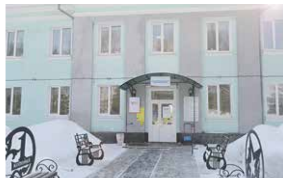
Избирательный участок №137 в Детской школе искусств откроет свои двери для всех граждан нашей страны, которые в дни голосования находятся в Болотнинском районе, но не имеют местной прописки

для 96 человек. Голосующие впервые традиционно получат памятные подарки от избирательной комиссии Болотнинского района: ручку, открытку и брендовый картхолдер.