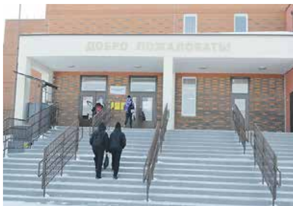
В школе №4 расположены два избирательных участка 143 и 144

В Болотнинском районе участие в выборах, согласно спискам, станет первым