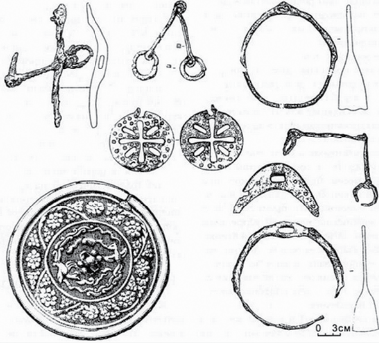
Материалы басандайской культуры из могильника Ташара — Карьер — 2 (Мошковский район Новосибирской области)

В I веке н.э. Римская империя, сделавшая Средиземное море своим внутренним озером, продолжает расширение своих границ по всем направлениям: до 117 года Рим присоединяет Галлию, Британию, Дакию, Набатейское царство, Армению, Месопотамию, римляне в 116 году, тесня на востоке Парфию, доходят до Персидского залива и захватывают столицу парфян Ктесифон. Затем наступает период, когда дальнейшее расширение территории становится невозможным,