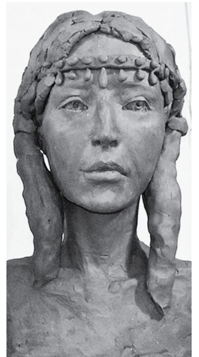
Реконструкция внешнего вида ирменской девушки по черепу из могильника Фирсово в Алтайском крае

Около 3400 года до н.э. появилась клинописная письменность в Месопотамии. Около 3100 года до н.э. появилось иероглифическое письмо в Египте. Около 2800 года до н.э. возникла до сих пор нерасшифрованная современными учеными письменность в долине Инда. Вскоре за ней возникла письменность на острове Крит, до сих пор расшифрованная современными учеными лишь частично. Около 2000 года до н.э. возникла