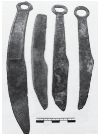
Бронзовые ирменские ножи из материалов поселения Гришкина Рыбалка в Тогучинском районе Новосибирской области

В 4-м тысячелетии до н.э. в Месопотамии появляется город Ур. Около 3200 года до н.э. в Египте возникает Луксор (Фивы). В начале 3-го тысячелетия до н.э. в Египте появляется город Мемфис. В середине 3-го тысячелетия до н.э. в Египте строятся первые пирамиды. Между 3000 и 2600 годами до н.э. относят первые постройки на месте древней Трои. Около 2700 года до н.э. на острове Крит возникает минойская цивилизация. Около 2600 года до н.э. возникает один из крупнейших городов древности — Мохенджо-Даро, являвшийся одним из центров харапской цивилизации в Индии. К этому времени относят и постройку крупнейшей из египетских пирамид — пирамиды Хеопса в Гизе. Предположительно, в 2559 году до н.э. рядом с ней была создана знаменитая монументальная скульптура сфинкса. К 2400 году до н.э. относят наиболее ранние археологические находки в Вавилоне (к 2200 году