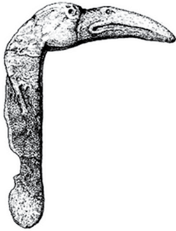
Костяное навершие из кротовского могильника Сопка-2 (Венгеровский район Новосибирской области)

Обнаруженные могильники игрековской культуры включают в себя грунтовые и курганные захоронения, в том числе вторичные. Погребения ориентированы на север и северо-восток. Умерших клали в вытянутом положении на спину или в скорченном состоянии на бок. В могилы к умершим помещали предметы труда из камня и кости, керамику. Керамика имела плоское или округлое днище, была орнаментирована отгистками гребенки, резкими линиями, отступающей палочкой. Металлические (медные и бронзовые) изделия были представлены пока только