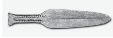
Бронзовый кинжал из кротовского могильника Сопка-2 (Венгеровский район Новосибирской области)

Одомашнивание лошади впервые произошло, вероятно, в ареале ботайской археологической культуры, располагавшейся в конце 4-го — начале 2-го тысячелетия до н.э. на территории Урало-Тобольского междуречья. Археологи указывают, что здесь появилась начальная стадия коневодства. Ботайцы использовали лошадей для хозяйственных целей (для перемещения грузов в санях и как источник молока, мяса и кожи). Исследователи отмечают, что ботайцы, владевшие навыками приручения лошадей, не вели целенаправленную селекцию. Современные породы лошадей имеют лишь 2,7% прироста от неизвестной сегодня популяции лошадей. Считается, что ботайские лошади генетически были близки к лошади Пржевальского, в ряде работ они также представлены предками лошади Пржевальского.