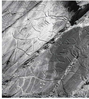
Неолитические петроглифы с изображениями лосей, Томская писаница

Ученые предполагают, что формированию оседлого образа жизни неолитического населения