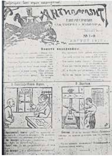
«Антипаразит». Приложение к газете «Пролетарская мысль»

Обычно приложения занимали последнюю страницу «Пролетарской мысли», но иногда выходили и на отдельных листах. Рассчитаны они были на целевую аудиторию. «Дети сохи и молота» — на комсомольцев и им сочувствующую молодежь, «Голос работницы и крестьянки» — на стремящихся к эмансипации женщин, «Букварь» — на тех,