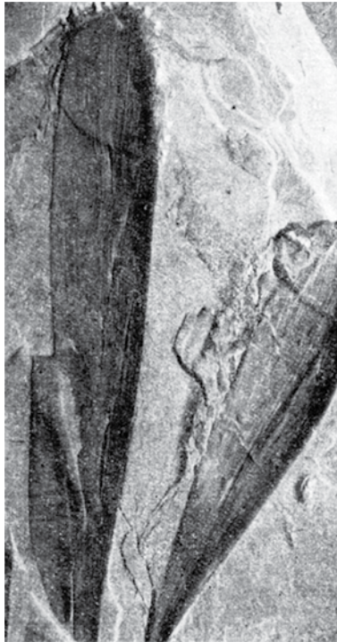
Отпечатки листьев кордаитов в каменноугольной породе

33 миллиона лет назад появляется древняя водная артерия — река Обь.