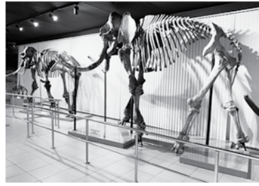
Скелеты мамонтов в экспозиции Новосибирского государственного краеведческого музея

В разные периоды таких оледенений (90–60 тысяч лет назад и 40–31 тысяч лет назад) на территории Западной Сибири и Новосибирской области в частности существовало так называемое Западно-Сибирское море или озеро, когда ледник переграживал русла рек Обско-го бассейна.