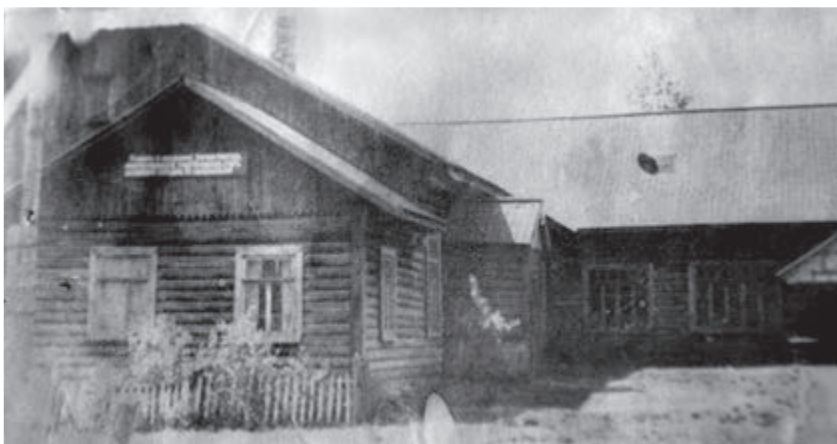
Здание первой школы в Большеречке