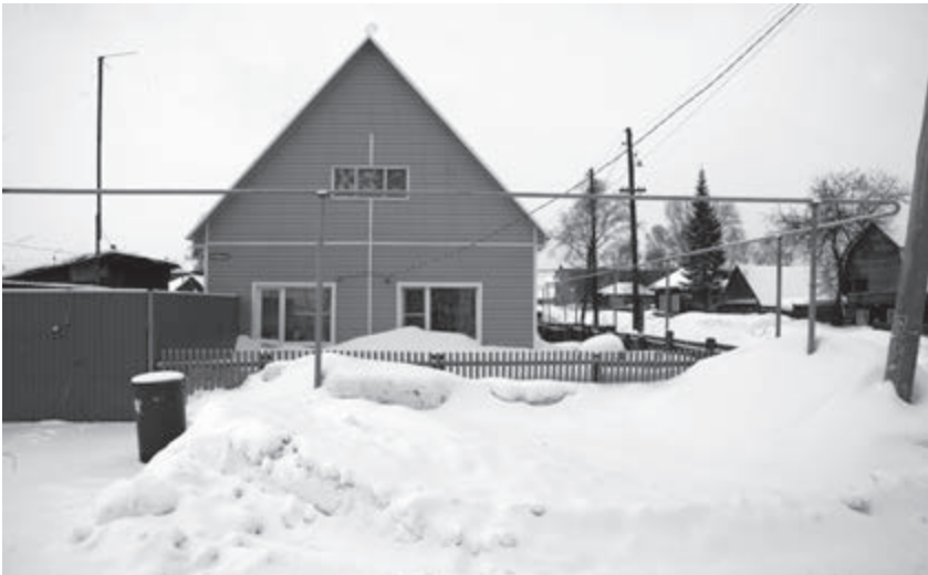
Дом на ул. Октябрьская, 22