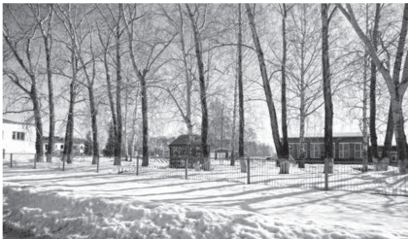
На этом месте стояла первая Варламовская школа